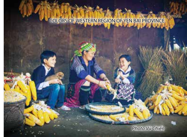
COLORS OF WESTERN REGION OF YEN BAI PROVINCE

LIM MONG VILLAGE: Standing from this side of the arduous Khau Pha Pass, looking straight ahead and seeing a thin thread-like road straight up to the sky. The far-off place has a small village which is called as Lim Mong, one of the best places to see the most beautiful rice fields in Mu Cang Chai district.