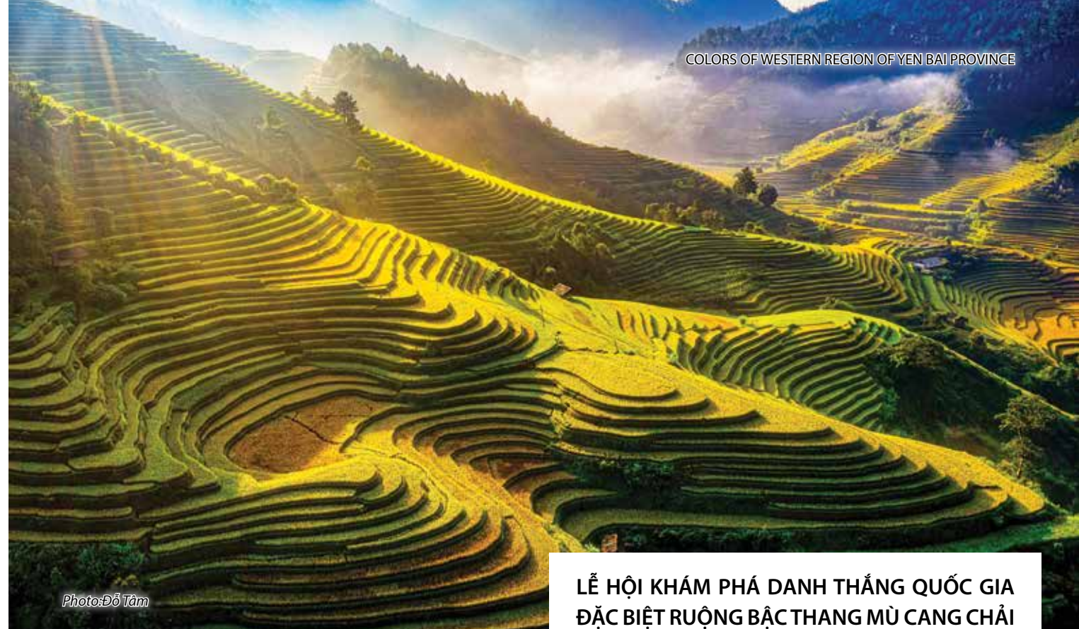
COLORS OF WESTERN REGION OF YEN BAI PROVINCE